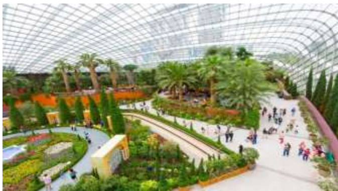
ต้นไม้ฟุ้งกระจายไปทั้งโดม

Flower Dome จะเป็นที่จัดแสดงพรรณไม้จากเขตร้อนชื้นแถบเมดิเตอร์เรเนียน มีต้นไม้ตัดยักซ์และพาล์มชวดมากมายให้เราได้ถ่ายรูป รวมถึงมีสวนจิ๋วน่ารักๆ ให้เราดูอีกด้วย เหมาะแก่การไปนั่งอ่านหนังสือ นั่งเล่นชิลๆ เพราะในเรือนกระจกจะติดแอร์ให้อากาศเย็นสบาย และมีกลิ่นหอมๆ ของดอกไม้และ