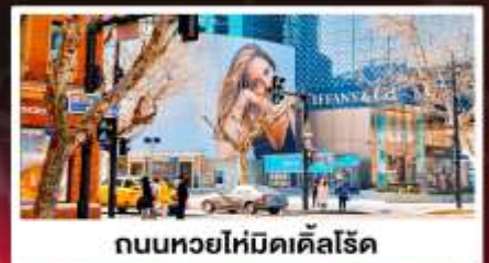
ถนนหยอไห่มีดเคิลโรด