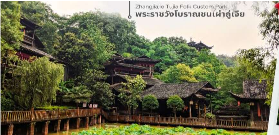
Zhangjiajie Tujia Folk Custom Park พระราชวังโบราณชนเผ่าตู่เจี๋ย

นำทุกท่านเดินทางสู่ พระราชวังโบราณของชนเผ่าตู่เจี๋ย เป็นสถานที่ท่องเที่ยวที่สำคัญในเมืองจางเจียเจี้ย ประเทศจีน ซึ่งเป็นที่อยู่อาศัยของชนเผ่าตู่เจี๋ย. ภายในพระราชวังมีการแสดงวิถีชีวิต พิธีกรรม และวัฒนธรรมของชนเผ่าตู่เจี๋ย. นอกจากนี้ยังมีอาคาร 9 ชั้นที่สร้างจากไม้ ซึ่งเป็นที่พำนักของเจ้าเมืองในอดีต ซึ่งปัจจุบัน สามารถขึ้นไปชมได้ แต่ละชั้นจะมีแสดงเสื้อผ้าของใช้ของฮ่องเต้ รวมถึงของพื้นเมืองให้เราดู ด้านบนสุดเห็นวิวเมืองด้วย สวยงาม และด้านหลังยังมีอาหารใหม่ที่สร้างหลังอาคารใหญ่ๆ จะมี 2 อาคาร มีบ่อน้ำตามีหลักฮวงจุ้ย