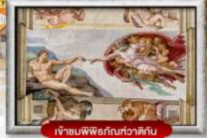
เข้าชมพิพิธภัณฑ์ทวารดิกัน