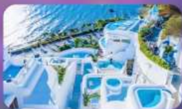
ซาโตรีนี่