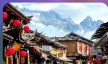
เมืองโบราณซาซี