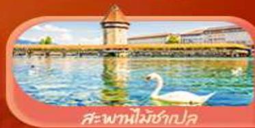
สะพานไม้ซังปก

Highlight เยือนหมู่บ้านแสนสวยเซอร์แมท เช็กอินศาลาไทยสุดงามที่โลซาน เที่ยวลูเซิร์น ชมสะพานไม้ซังและอนุสาวรีย์สิงโต ซาลี แอปสทิน ชมประติมากรรม The Fork และปราสาทซิลลองริมทะเลสาบ เยือนมิลาน มหาวิหารดูโอโม เที้ยวเวนิส เมืองลอยน้ำสุดโรแมนติก อินกับรักอมตะที่บ้านจูเลียต และช้อปปิ้งจุใจที่ Serravalle Outlet