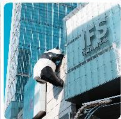
IFS ตึกหมีแพนด้า

● ไอโกล์ นั้งกระเช้าขึ้นชมภูเขาหิมะว้าวู๋ ซ็อบบั้งถนนซุนซีลู่ แลนด์มาร์คแพนด้ายักษ์เป็นตึก IFS เจิงตุ