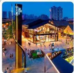
ถนนคนเดินไท่กุ๋หลี