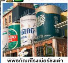
พิพิธภัณฑ์เบียร์ชิงเต่า