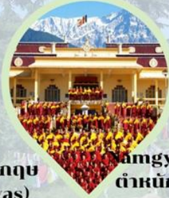
Amgyal Monastery ตำหนักองค์ดาไลลามะ ดาร์มซาล่า