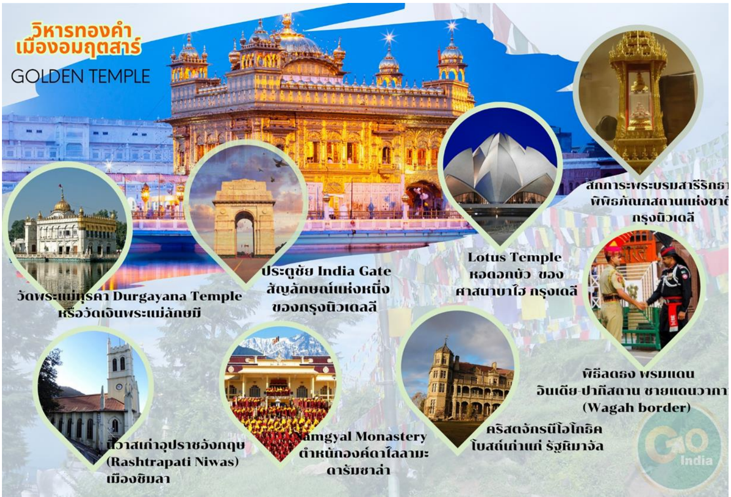
วัดพระแม่สุคา Durgayana Temple หรือวัดเงินพระแม่ลักษมี