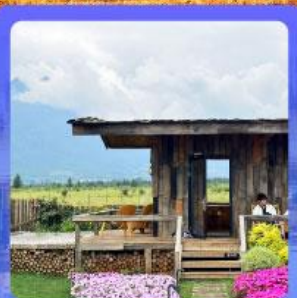
ร้านกาแฟหยุนตัน