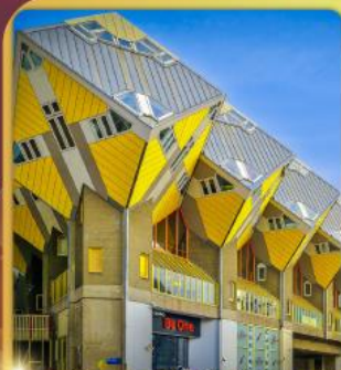
บ้านลูกเต่าโคกคูบัส

“ล่องเรือหลังคากระจก” ชมกรุงอัมสเตอร์ดัม