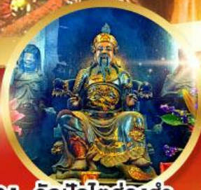
วัดปักไต้ฮ้องฮำ

ขอพรความสำเร็จ การงาน ขอพรความสำเร็จในชีวิตการทำงาน