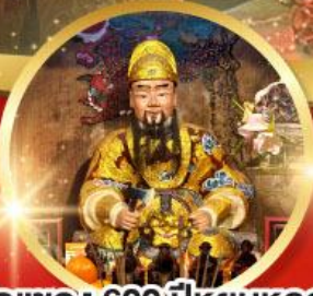
วัดแซง 600 ปี หุ่นหลวง

ขอพรความสำเร็จ การงาน ขอพรความสำเร็จในชีวิตการทำงาน