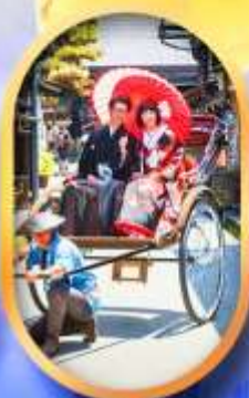
ศาลเจ้าจิ้งจอก