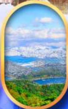
ทะเลสาบมิกะตะ