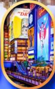
ย่านชิบโฮบาชิ