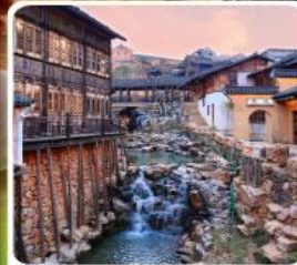
เมืองโบราณเหยahu