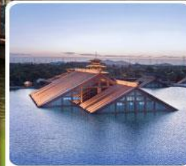
พิพิธภัณฑ์ไดน้ำ กวางฟู่หลิน