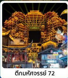
ตึกหอคจรรย 72