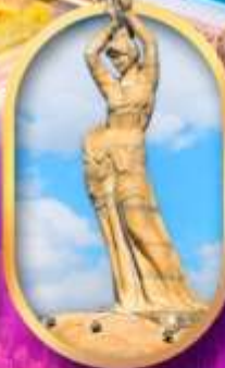
เด็กหญิงชาวประมง