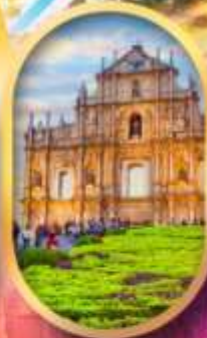
โบสถ์เซนต์พอล