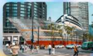
เรือทลยส์วิตคอง