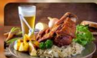
พิเศษ! ลิ้มลองเมนูประจำชาติ ถึง 5 ประเทศ!!!