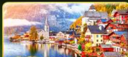
การันตีพัก Hallstatt / St. Wolfgang หรือริมนทะเลสาบ 1 คืน