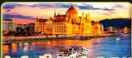
ส่องเรือแม่น้ำดานูบ ช่วง Twilight พร้อมจินตนาการ

📅 เดินทาง: 02-09 ธ.ค. | 06-13 ธ.ค. 10-16 ธ.ค. 69