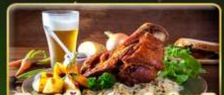
พิเศษ! ลิ้มลองเมนูประจำชาติ ถึง 5 ประเทศ!!!