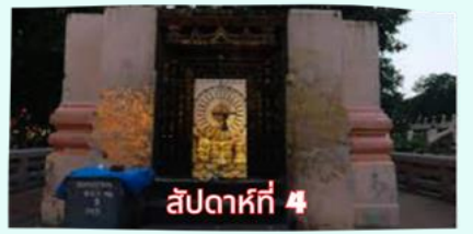
สัปดาห์ที่ 4 รัตนขรเจดีย์ (ซุ้มเรือนแก้ว)

เรียบร้อยแล้ว นำคณะจาริกบุญสวดมนต์ทำวัตรเย็น บูชาพระรัตนตรัย และสวดมนต์บูชาสังเวชนียสถาน จากนั้นเชิญท่านทำศนาธรรม นั่งสมาธิปฏิบัติบูชาตามอรรถาจารย์ สมควรแก่เวลา นัดหมายเวลาเชิญท่านกลับโรงแรมที่พัก