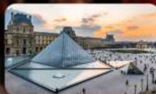
เข้าชมพิพิธภัณฑสถานลูฟวร์